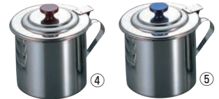
EBM モリブデン 蝶番付 ソースポット