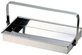
①EBM 18-0 お好み岡持ち