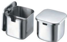
⑥クローバー モリブデン プレス 角 タレ入