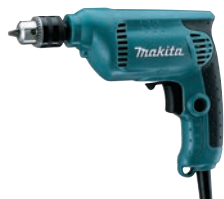
㉔マキタ 電動式ドリル 6412 団