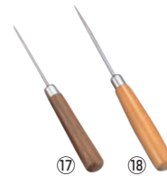
⑰木柄 へり引 TS-134