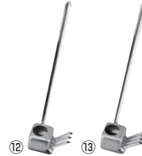
EBM 18-8 ウナギタレカケ