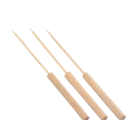
⑳竹たこ焼ピック (100本入)