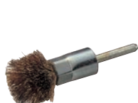
㉓ワイヤーボタン タコ焼きブラシ (ドリル用)